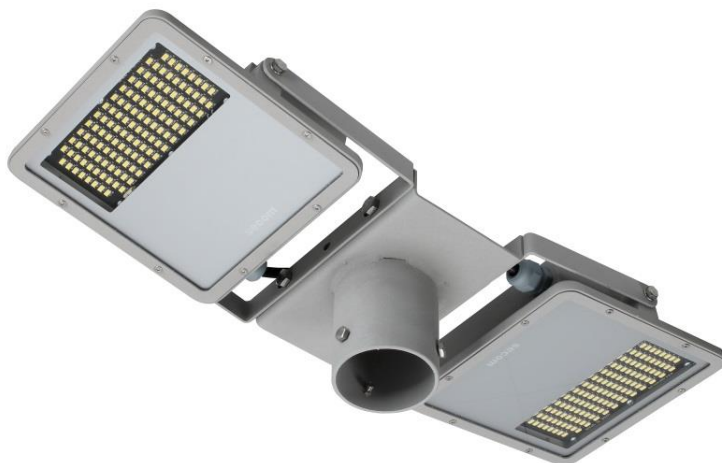
Protek City LED